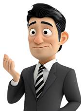
Gensparkを活用した情報収集の時間削減